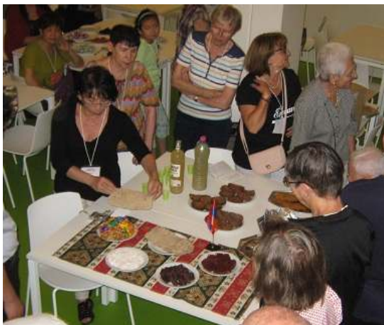
Interkona frandvespero en Oostende 2015

Ĉio ĉi signifas novajn vojojn de lernado , kiujn priantentis la 49-a konfe- renco de ILEI tra diversaj formoj de la konferenca programo, inkluzive de la