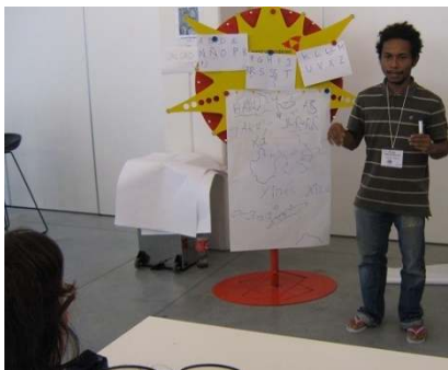
Lingva festivalo: la tetuna lingvo el Orienta Timoro (2015-07-21)

La tradiciaj Interkona frandvespero , Nacia , Internacia kaj Adiaŭa vesperoj , Lingva festivalo kaj Konferenca bankedo estas siaspecaj identigiloj de la konferencoj de ILEI. La diligenta kaj entuziasma LKK en Nyíregyháza planas aldoni Konferencan balon al la vespera programo. Por la junaj konferencanoj kaj ĉiuj kiuj sentas sin junaj, ni planas noktan amikan kaj muzikan programon kaj sportajn posttagmezojn.