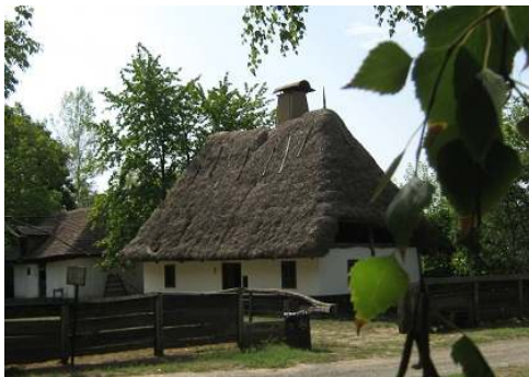
El etnovilaĝa muzeo ĉe Nyíregyháza

La turisma programo per duontagaj kaj tuttagaj ekskursoj konigos al la konferencanoj la urbon mem, la proksimajn sal-lagan bankuracejon, bestĝardenon kaj etno-vilaĝon, kaj iom malpli proksimajn regionojn de Tokaj kun la famaj vinkeloj kaj regionon kie situas la Muzeo de Kolomano Kalocsay.