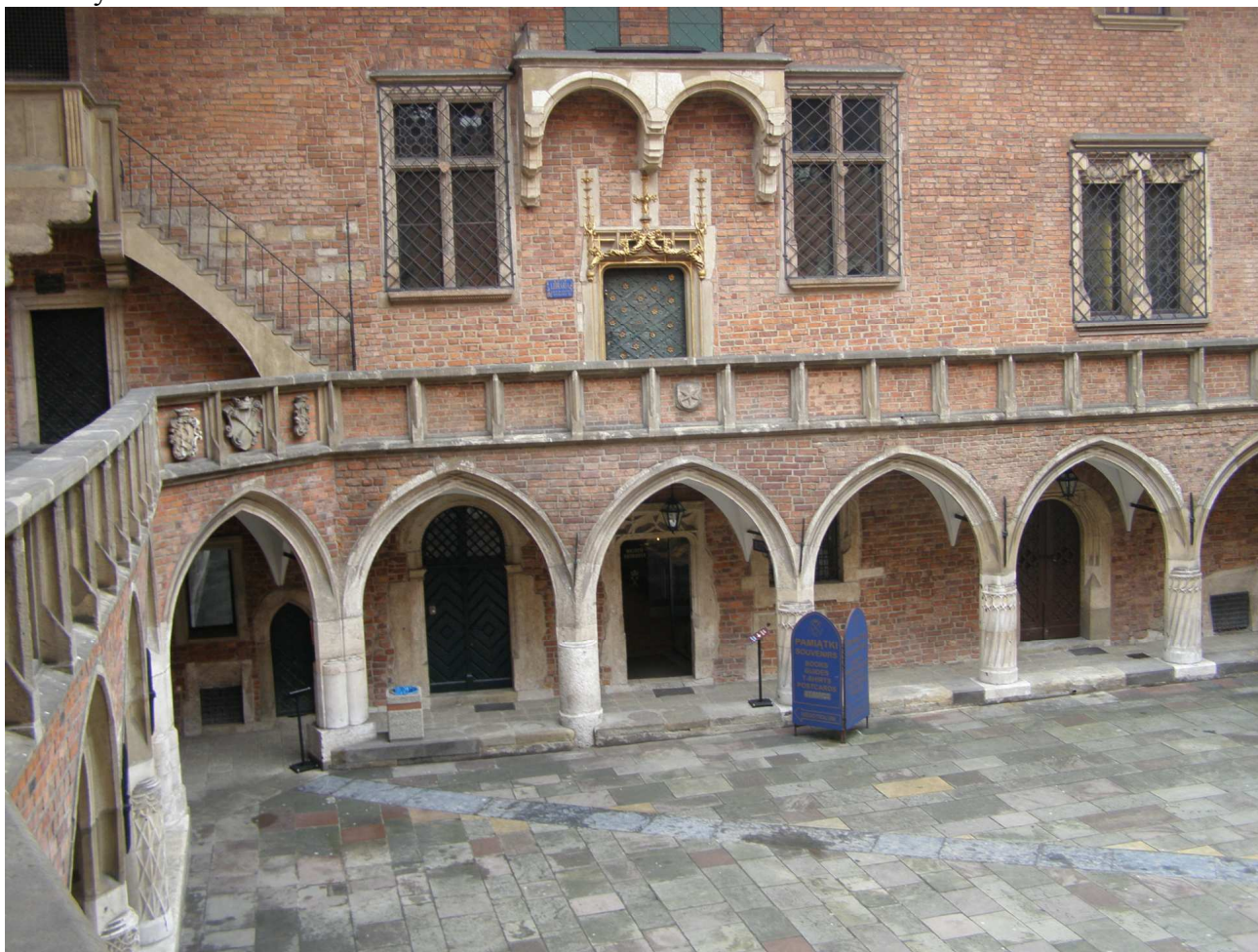
Collegium Maius en Krakovo