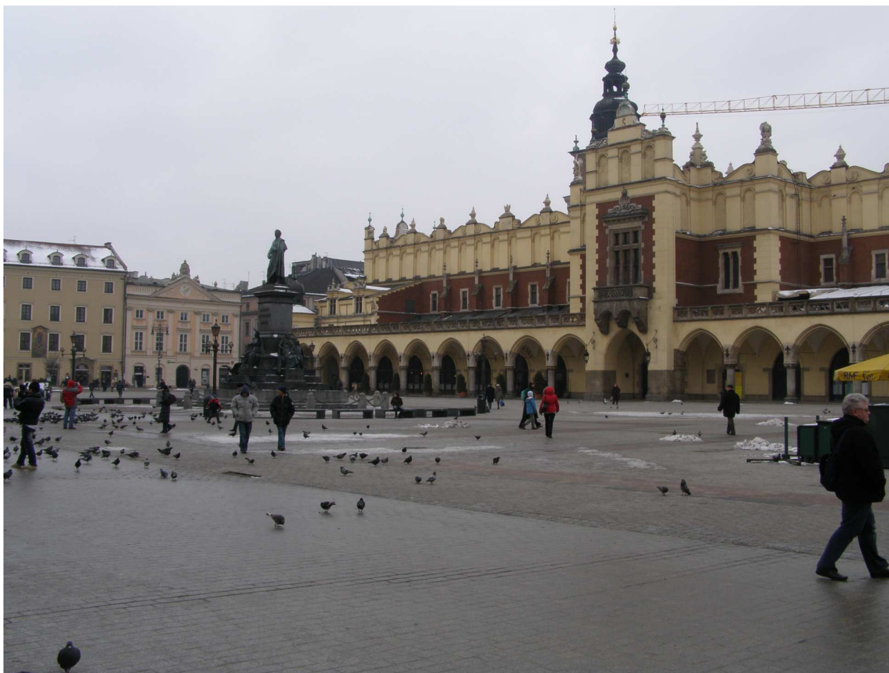
Draphalo en Krakovo

En 2005 la lernejo estis distingita per "Premio de la Studenta Medio 2005", kiu estas atribuita de la Studenta Parlamento de Pola Respubliko en la kategorio "Studento-amika lernejo".