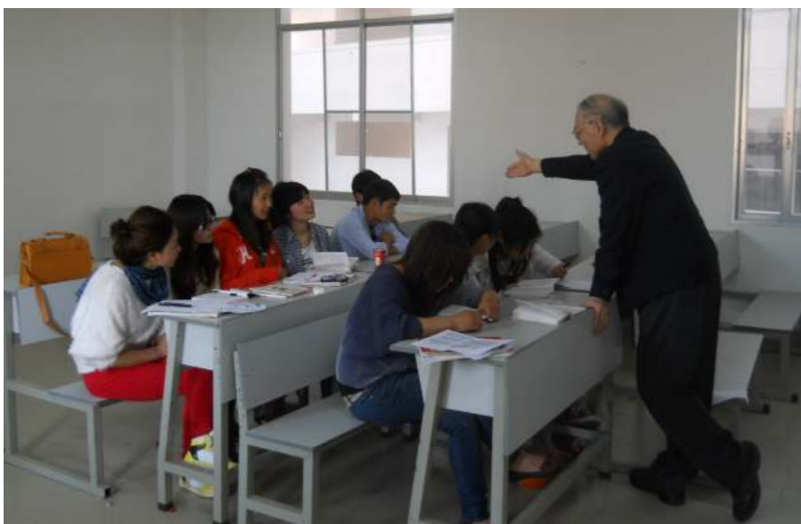
E-kurso en Kunming prepare al nia 45-a Konferenco (vd p.35)