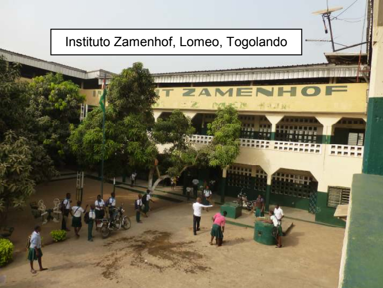
Instituto Zamenhof, Lomeo, Togolando