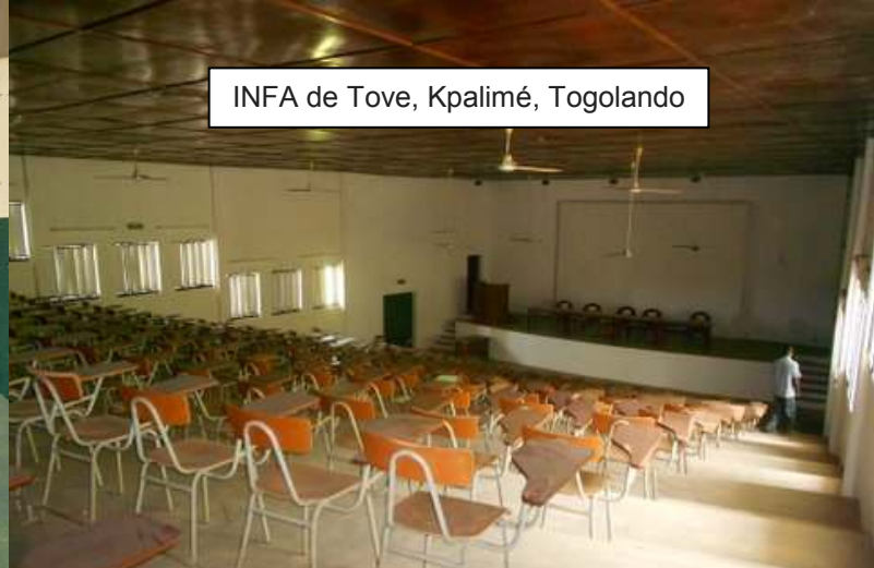
INFA de Tove, Kpalimé, Togolando