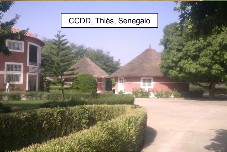
CCDD, Thiès, Senegalo