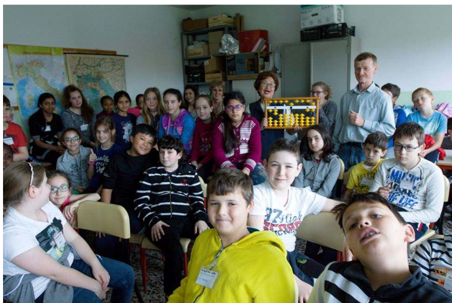
Lernantoj kaj gepatroj en la klasĉambro dum la leciono de Sorobano.