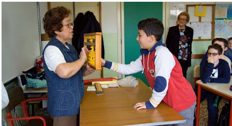
Jen vigla lernanto, kiu montras per Sorobano la numeron indikitan de Kimie.